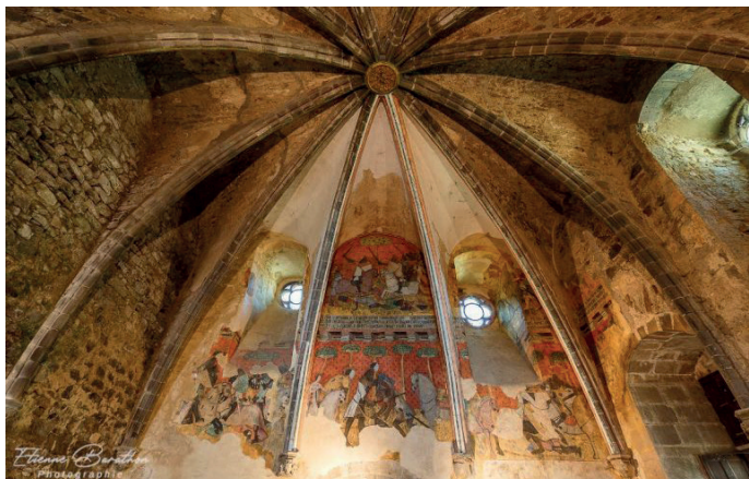
La Salle gothique et la fresque de Tristan et Yseult.

Another room is open to the public since 2011, containing a superb roof frame and remains of period tiled floor. From the top of the dungeon, the visitor will have an unforgettable panoramic view of the village and landscape; one may then go to visit the "butte de Chastel" - mound of Chastel, where both a Merovingian ossuary and a chapel dating from the XIV th century with mural paintings showing the Lord of Saint-Floret and his family can be seen there.