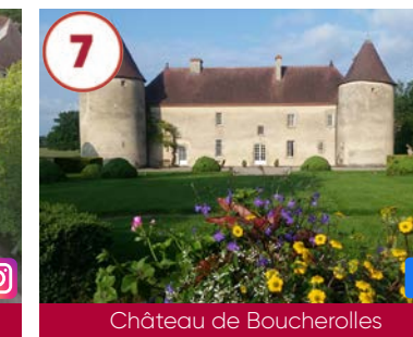
7 Château de Boucherolles XV e siècle

Visite libre gratuite Visite guidée par groupe (10 pers.) 10€ 03330 Bellenaves 04 70 58 34 20 www.auvergne-destination.com