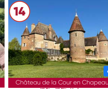
14 Château de la Cour en Chapeau XVI e - XVII e siècles

Visite guidée : Plein tarif 13€ Groupe 10€ / Gratuit -12 ans 03440 Buxières-les-Mines 07 51 83 97 73 www.auvergne-destination.com