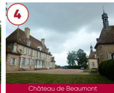
4 Château de Beaumont XVIII e siècle

Plein tarif 12€ / Tarif réduit 5€ Gratuit -8 ans 03460 Villeneuve-sur-Allier 06 70 11 55 32 www.arboretum-balaine.com