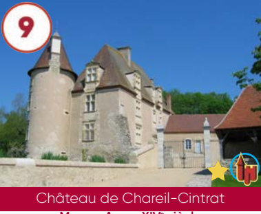
9 Château de Chareil-Cintrat Moyen-Âge - XIV e siècle

Plein tarif 3€ / Groupe et famille 2€ 03370 Saint-Désiré 02 48 63 00 84 www.chateaubussiere.fr