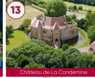
13 Château de La Condemine XIV e siècle

Plein tarif 5€ / Tarif réduit 2€ 03450 Chouigny 04 70 59 81 77 www.chouigny.net