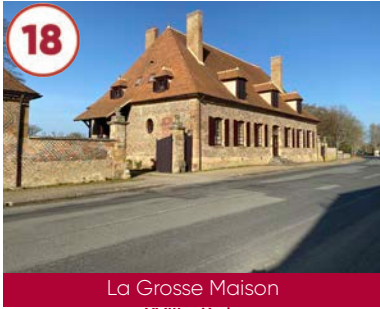
18 La Grosse Maison XVIII e siècle

Plein tarif 6€ / Gratuit -15 ans 03240 Le Theil 06 43 74 10 65 www.chateau-de-fontariol.org