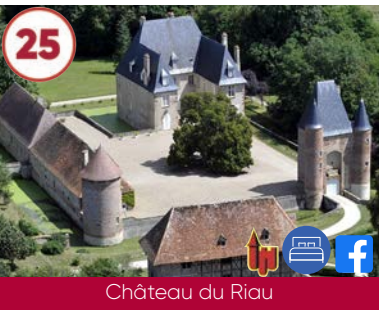
25 Château du Riau XV e - XVI e - XVII e siècles

Visite guidée : Plein tarif 8€ / Gratuit -12 ans 03230 Lusigny 06 81 59 88 25 www.chateaupomay.fr