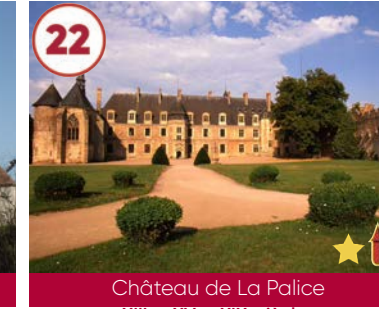
22 Château de La Palice XIII e - XV e - XIX e siècles

Gratuit 03340 Bessay s/Allier 04 70 43 08 62 www.auvergne-destination.com