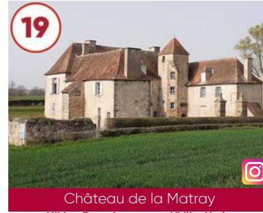
19 Château de la Matray XIV e - Renaissance - XVII e siècle

Gratuit 03230 Chevagnes 06 12 73 10 22 www.auvergne-destination.com