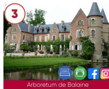
3 Arboretum de Balaine XIX e siècle

Plein tarif 5€ / Tarif réduit 3€ 03460 Trévol 04 70 42 61 13 www.chateauavrilly.com