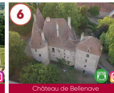
6 Château de Belenave XIII e - XVII e - XVIII e siècles

Accès jardins 2€ 03290 Saint-Pourçain-sur-Besbre 06 70 04 89 67 www.beauvoir-bourbonnais.fr