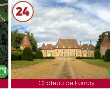
24 Château de Pomay XVII e siècle

Plein tarif 10€ / Tarif réduit 8€ Groupe : se renseigner 03190 Vallon-en-Sully 04 70 05 20 24 www.chateaudepeuffeilhoux.fr