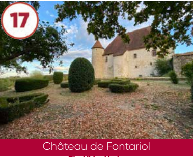
17 Château de Fontariol Fin XV e siècle

Gratuit 03340 Neuilly-le-Réal 04 70 43 80 05 www.auvergne-destination.com