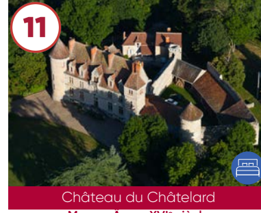
11 Château du Châtelard Moyen-Âge - XVI e siècle

Plein tarif 8€ / Gratuit -12 ans Tarif groupe sur consultation 03210 Marigny 06 07 18 89 58 www.auvergne-destination.com