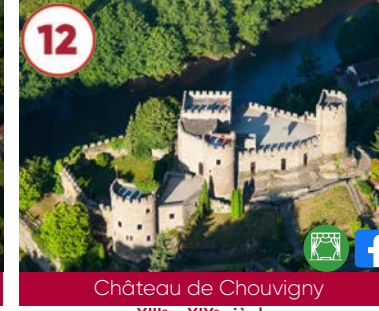
12 Château de Chouigny XIII e - XIX e siècles

Gratuit 03450 Ebreuil 06 74 02 16 18 www.lechatelard-a-ebreuil.weebly.com