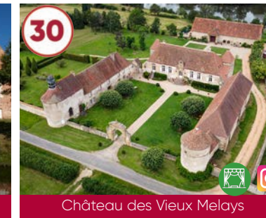
30 Château des Vieux Melays XVII e siècle

Plein tarif 5€ 03470 Saligny s/Roudon 04 70 42 21 32 www.auvergne-destination.com