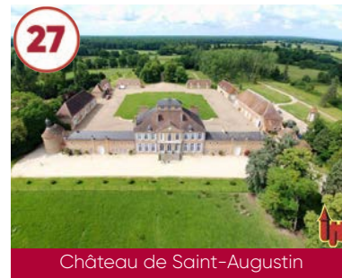
27 Château de Saint-Augustin XVIII e siècle

Plein tarif 6,50€ 03800 Saint-Bonnet-de-Rochefort 06 23 18 04 67 www.auvergne-destination.com