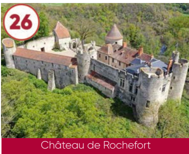
26 Château de Rochefort XII e - XIII e - XVII e - XIX e siècles

Plein tarif 7€ / Tarif réduit 6€ 03460 Villeneuve-sur-Allier 04 70 43 34 47 www.chateau-du-riau.com