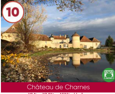
10 Château de Charnes XV e - XVII e - XIX e siècles

Plein tarif 4€ / Gratuit -18 ans 03140 Chareil-Cintrat 04 70 56 94 28 www.chareil-cintrat.fr