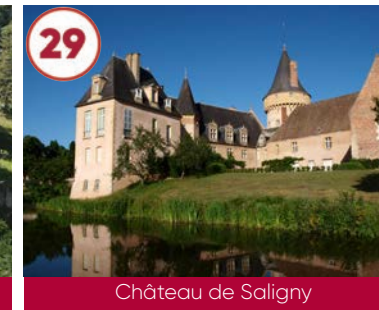
29 Château de Saligny Moyen-Âge - Renaissance

Gratuit 03150 Saint-Gérand-le-Puy 06 82 82 59 91 / 06 11 65 31 79 www.auvergne-destination.com