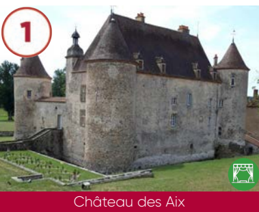
1 Château des Aix Moyen-Âge - XVII e - XVIII e siècles

Du 4 au 28 juillet - du 1er au 25 août du 5 au 15 septembre Du lundi au jeudi 9h-12h et 14h-17h Plein tarif 7€ / Groupes 5 (+10 pers.) Gratuit -18 ans