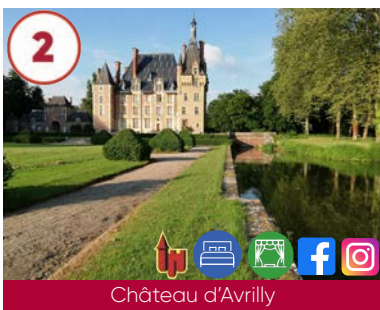
2 Château d'Aavrilly XV e - XIX e siècles

03500 Meillard 06 10 75 84 86 www.auvergne-destination.com