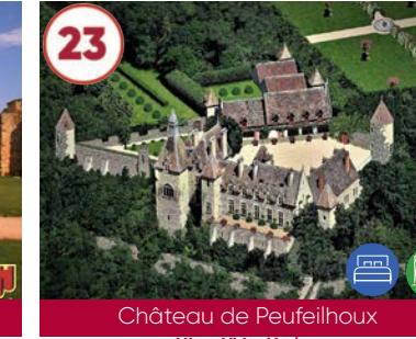
23 Château de Peuffeilhoux XI e - XV e siècles

Plein tarif 8€ / Tarif réduit 5€ Gratuit -5 ans / Groupe : se renseigner 03120 La Palisse 04 70 99 37 58 www.lapalisse-tourisme.com