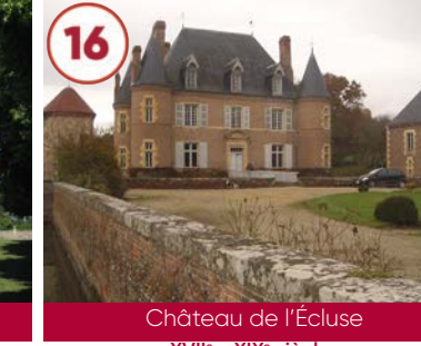
16 Château de l'Écluse XVII e - XIX e siècles

Gratuit 03140 Etroussat 04 70 45 32 73 www.auvergne-destination.com