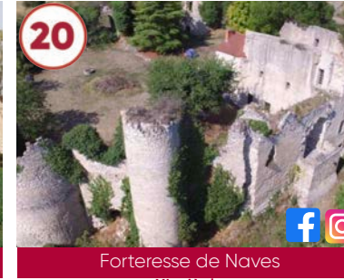
20 Forteresse de Naves XI e siècle

Plein tarif : 6€ / Tarif réduit 2 € Groupe 5 € / Gratuit -12 ans 03210 Souvigny 06 11 02 29 76 www.auvergne-destination.com