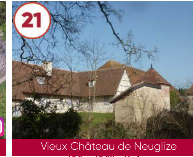
21 Vieux Château de Neuglize XVI e - XVIII e siècles

Gratuit 03330 Naves 06 13 70 49 08 www.allier-auvergne-tourisme.com