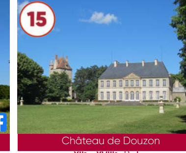
15 Château de Douzon XII e - XVIII e siècles

Plein tarif 5€ / Gratuit -12 ans La Cour 03340 Chapeau 07 82 36 09 97 www.auvergne-destination.com