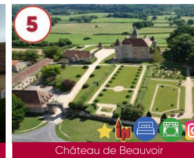
5 Château de Beauvoir XII e siècle - Renaissance / Parc XIX e siècle

Tarif libre 03210 Agonges 06 70 54 46 52 www.auvergne-destination.com