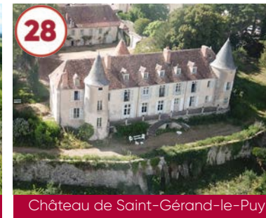
28 Château de Saint-Gérand-le-Puy XVI e - XVIII e siècles

Plein tarif 9€ / Tarif réduit 7€ Groupes 7€ (20 pers. min) / Gratuit -5 ans 03320 Château-sur-Allier 04 70 66 42 01 www.chateau-saint-augustin.fr