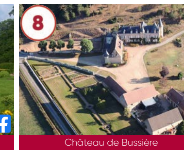
8 Château de Bussière XII e - XVI e - XIX e siècles

Gratuit 03240 Treban 04 70 42 32 35 www.auvergne-destination.com