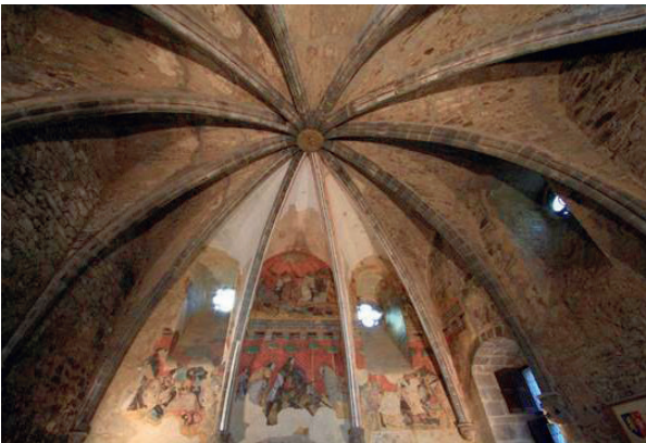
La Salle gothique et la fresque de Tristan et Yseult.

Another room is open to the public since 2011, containing a superb roof frame and remains of period tiled floor. From the top of the dungeon, the visitor will have an unforgettable panoramic view of the village and landscape; one may then go to visit the « butte de Chastel » -mound of Chastel, where both a Merovingian ossuary and a chapel dating from the 14th century with mural paintings showing the Lord of Saint-Floret and his family can be seen there.