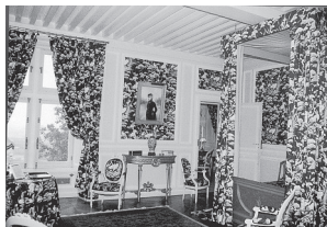
"La Chambre Bleue"

Wir bewundern eine bemerkenswerte Landschaft und ein ebensolches Panorama sowie einen hübschen, in Terrassen angelegten Park, weitläufige Wohnungen mit raffinierten Innenraumgestaltungen. Seltene Andenkensammlungen der Familie von La Fayette und des Amerikanischen Unabhängigkeitskriegs ziehen unsere Aufmerksamkeit auf sich.