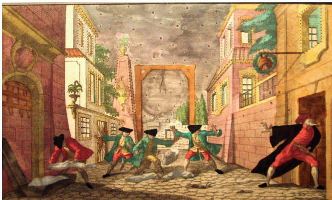
« La Commedia dell'arte, dans la collection de vues d'optique »

Gebaut auf den höheren Steigungen von Arlanc, zwischen Ambert und La Chaise-Dieu, ist das Schloß von Mons ein beträchtlicher und romantischer Wohnsitz, der im 11. Jahrhundert gegründet wurde und in 17. nach dem Modell der Medicis-Villa renoviert wurde. Der Eigentümer empfängt Sie dort für einen spannenden Besuch, der die Geschichte des Schloßes mischt, die Geschichte von Frankreich und besonders Ihnen seine Prägestampelsammlung in einer pädagogischen, einfachen und bereichernden Form vorstellt. Sie werden entdecken, durch seine Ansammlung über fünf Jahrhunderten, diese außerordentliche Weise des Verbreitens des Wissens, Kultur und Ästhetik zu allen Gesellschaftsklassen. Für alle Alter angebracht.