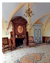
Le salon Henri IV

Visites de groupes réservées de 10 h à 12 h.